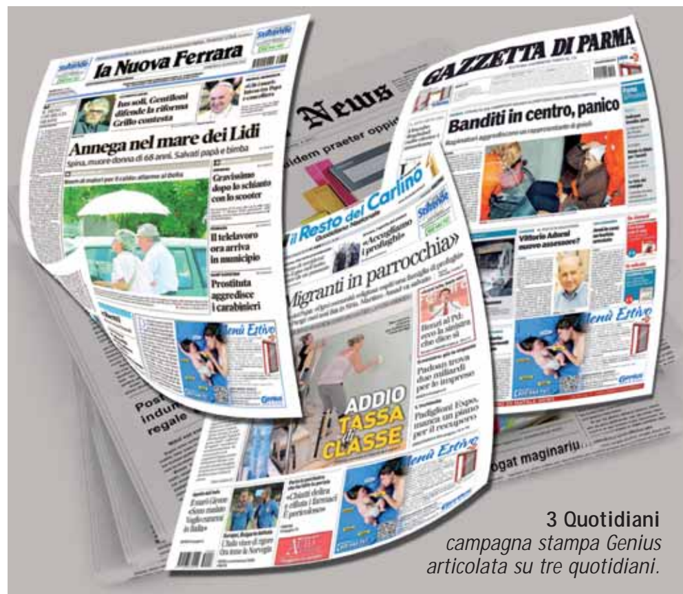
3 Quotidiani campagna stampa Genius articolata su tre quotidiani.

È anche vero, però, che i consumatori finali non sono degli "esperti" di zanzariere e che la loro facoltà di giudizio si basa, essenzialmente, sui consigli dell'installatore o sul sentito dire degli amici. Diventa imprescindibile, per un "brand" in espansione come il nostro, trasferire ai consumatori la percezione di benessere che deriva dall'installazione di una zanzariera, meglio se una Genius! Per questo, anche quest'anno, abbiamo deciso di rendere visibile al pubblico la nostra comunicazione e ne abbiamo aumentato la diffusione. A partire da fine Gennaio hanno cominciato a comparire sulle pagine della Nuova