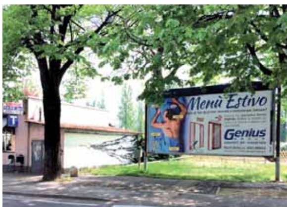
Affissioni poster: due soggetti per il medesimo messaggio.

annunci via radio sulle frequenze di Radio Sound . Il massiccio interesse suscitato presso il pubblico indifferenziato (non professionisti) ci conferma che una efficace comunicazione, con un messaggio chiaro, conciso e, perché no, anche spiritoso è un ottimo investimento per incentivare le vendite.