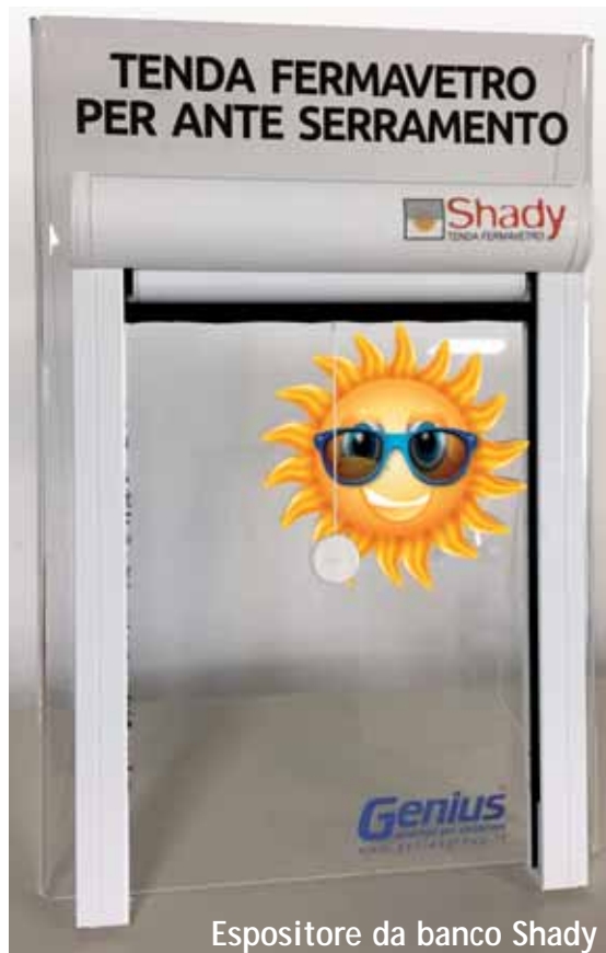
Espositore da banco Shady

un elegante e discreto espositore da banco, formato 30x40 cm circa, studiato per fare testare dal vero la praticissima Shady.