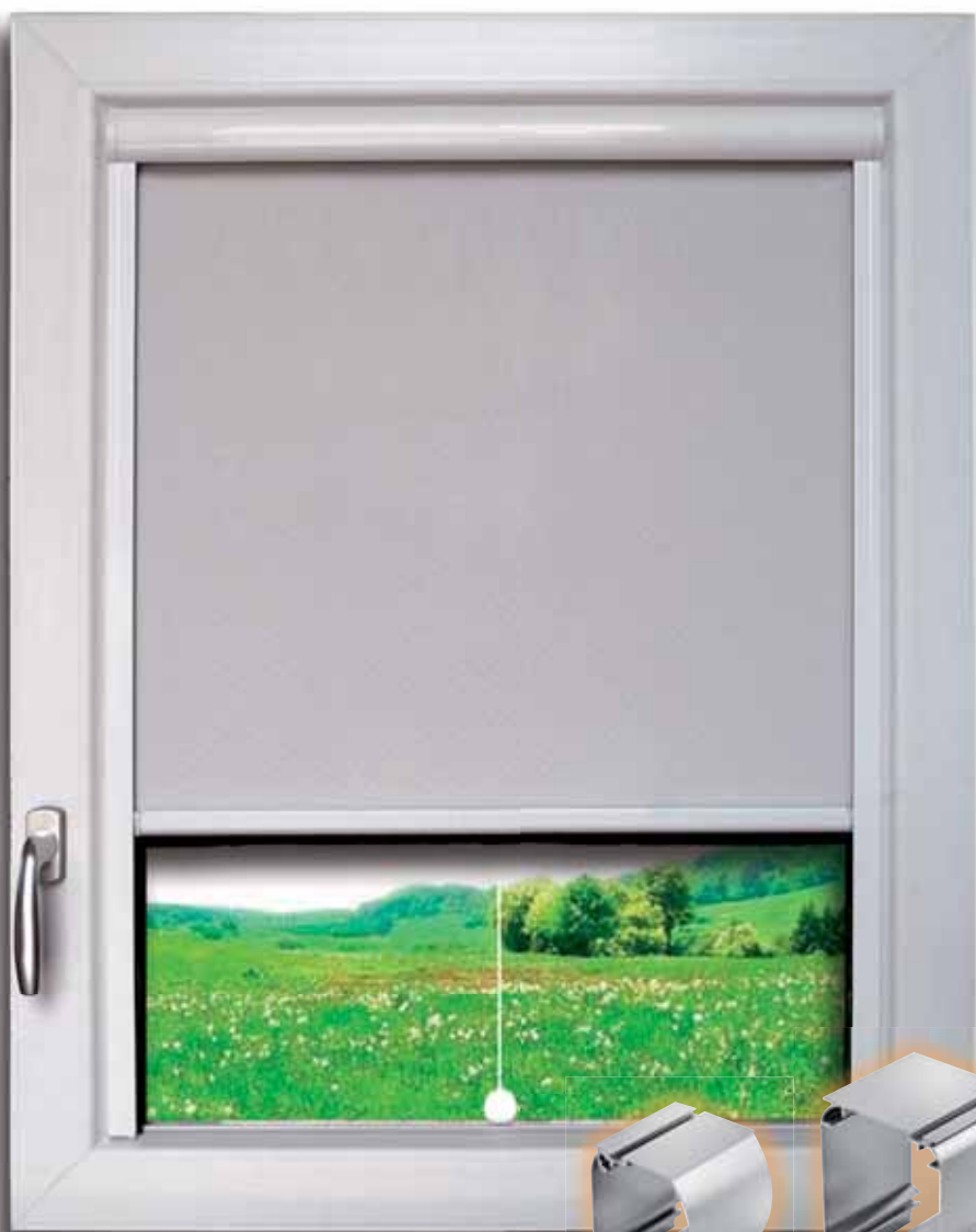
Nella foto sopra, cassonetto da 36mm in opera.

Grazie alla nostra esperienza nei sistemi avvolgibili possiamo proporre un affidabile sistema di filtratura solare adatto a tutti i serramenti con fermavetro.