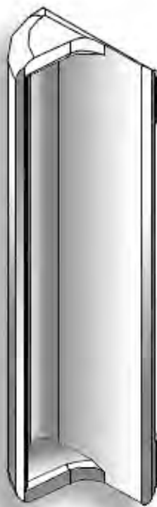
La nuova maniglia per il modello Plissè

Come annunciato anche nel numero scorso, con l'intento di soddisfare tutte le esigenze dei clienti, Genius ha realizzato una maniglia per i sistemi plissettati Plissè . Il successo ottenuto con l'aggiunta di un "semplice" accessorio è stato incredibile. Diverse le chiamate da parte di clienti "e non", per complimentarsi per la realizzazione della maniglia. Nonostante la sua introduzione sui vari colori sia graduale, in quanto sono stati modificati anche i profili, la nuova maniglia ha dato ancora di più vitalità ad un prodotto in continua crescita.