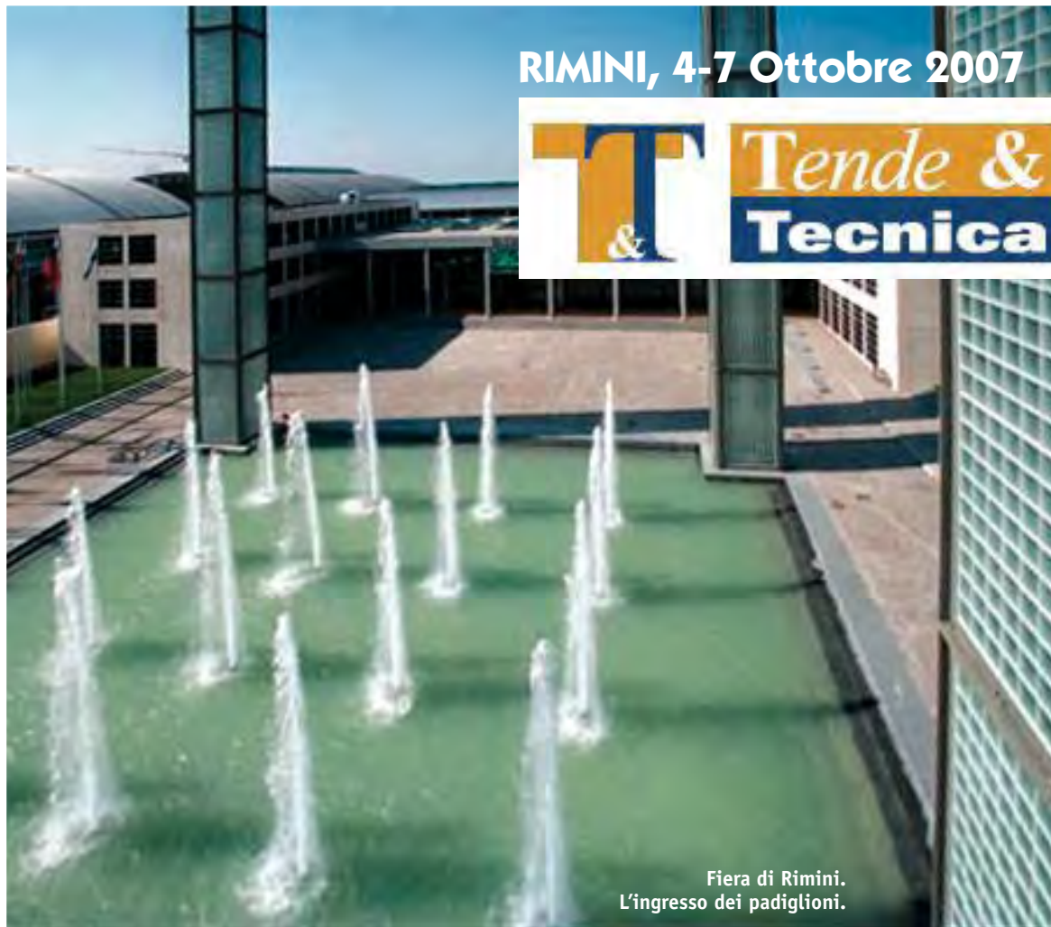
Fiera di Rimini. L'ingresso dei padiglioni.