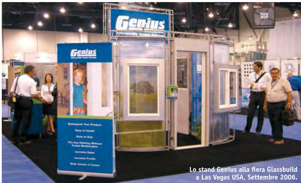
Lo stand Genius alla fiera Glassbuild a Las Vegas USA, Settembre 2006.

D iecimila visitatori, 489 espositori. Questi i numeri della fiera GLASSBUILD AMERICA , tenutasi a Las Vegas lo scorso Settembre. Il Gruppo Genius era presente con tutti i suoi prodotti tradizionali più alcune novità specifiche per il mercato Americano. E' stata l'occasione per il lancio negli USA del sistema di zanzariera plissettata per porte Plissè , sistema già famoso in Italia e Europa, ma praticamente sconosciuto oltreoceano. Il sistema, com'era prevedibile, ha riscosso un notevole successo fra gli operatori del settore. Particolare interesse è stato dimostrato nei confronti anche del sistema Automatic Window System (AWS) e del sistema integrato per Patio Door . Il sistema AWS è un sistema di zanzariera laterale per finestre scorrevoli, il cui scorrimento avviene in modo automatico insieme alla movimentazione della finestra stessa. Il sistema inte-