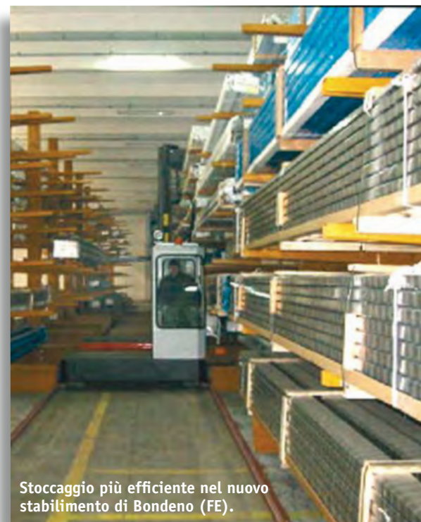
Stoccaggio più efficiente nel nuovo stabilimento di Bondeno (FE).