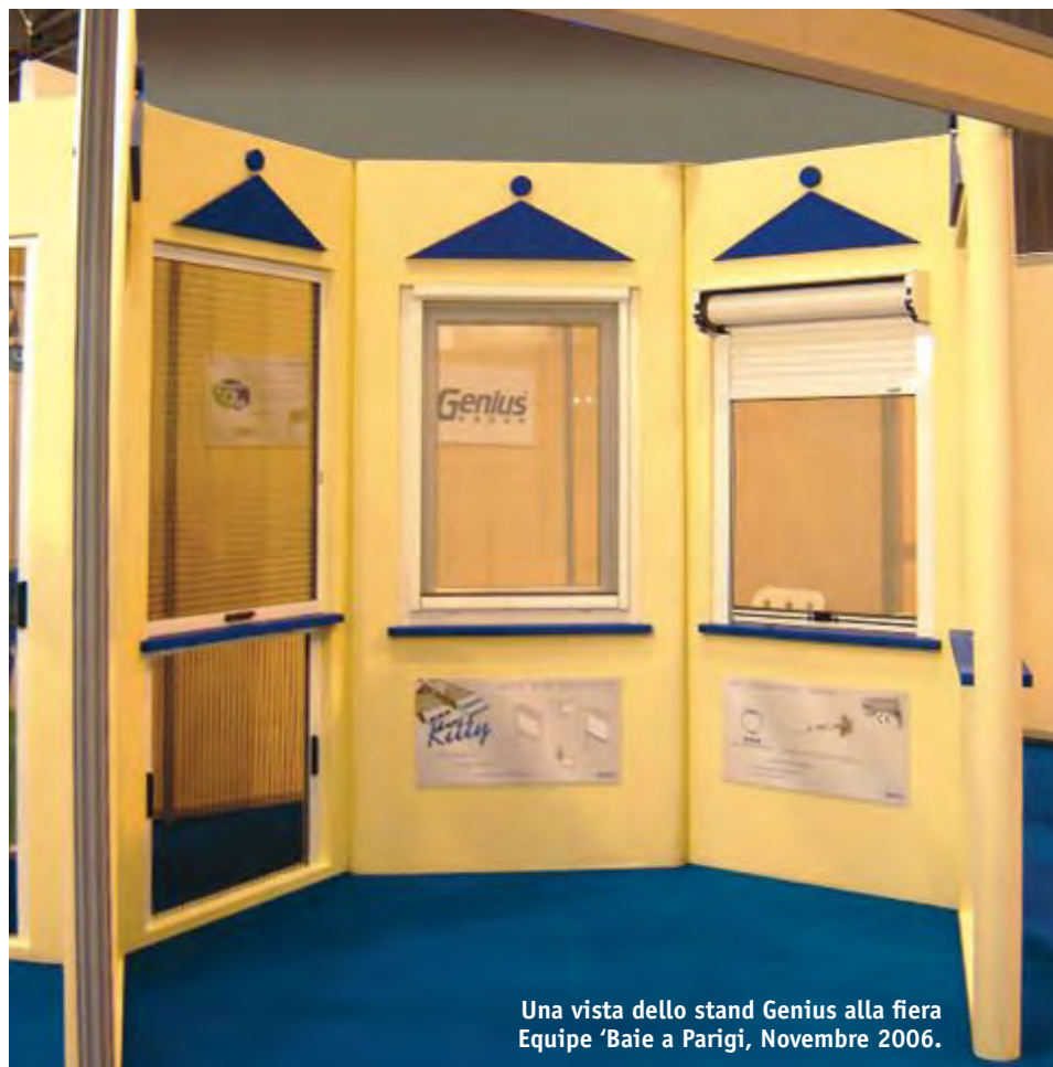
Una vista dello stand Genius alla fiera Equip 'Baie a Parigi, Novembre 2006.

Paesi di lingua francofona, che per ragioni storiche o culturali ruotano attorno al Paese d'oltralpe. Anche a Parigi sono state presentate le novità e gli aggiornamenti alle linee di prodotto già consolidate, quali le maniglie e i ganci di chiusura per la Plissé , la versione