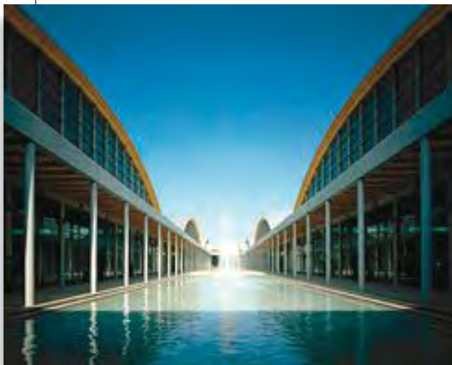
Vista del complesso fieristico di Rimini

grandi difficoltà nel trovare sistemazioni alberghiere, soprattutto a prezzi "ragionevoli". Di contro la fiera Tenda e Tecnica di Rimini è una manifestazione molto dinamica, in forte ascesa e specializzata nelle tende da interno e da esterno. La zanzariera si colloca quindi perfettamente in questo comparto merceologico. Il periodo, Ottobre , è l'ideale per il nostro settore ed infine Rimini ha un'offerta alberghiera praticamente illimitata e per tutte le tasche.