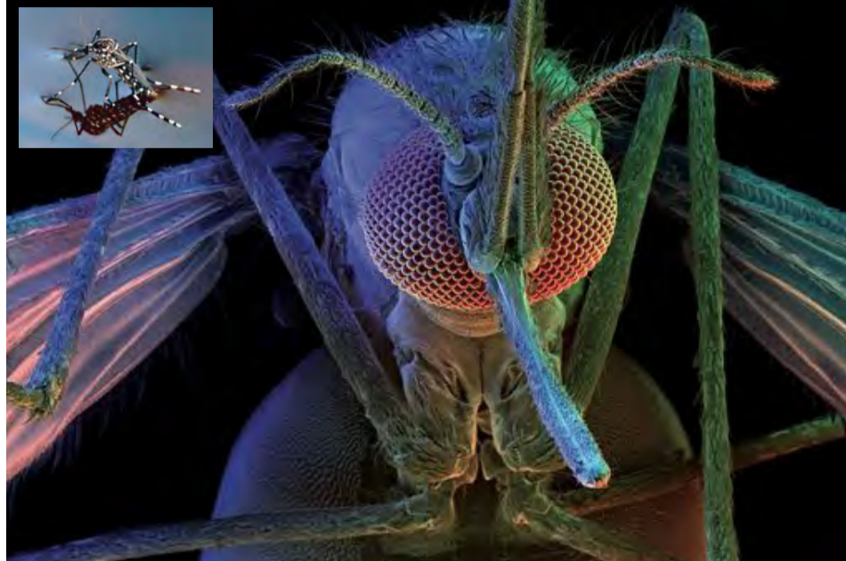
Zanzara-tigre vista al microscopio elettronico.

Infatti queste patologie non si trasmettono per contatto interumano diretto ma richiedono un “vettore” la zanzara, appunto, che “preleva” l'agente patogeno da un soggetto malato e lo trasmette all'ospite successivo. In alcuni casi i soggetti infettati provengono, o tornano dopo un viaggio, da zone dove queste malattie sono endemiche e portano inconsapevolmente con sé lo sgradito fardello. Ma sempre di