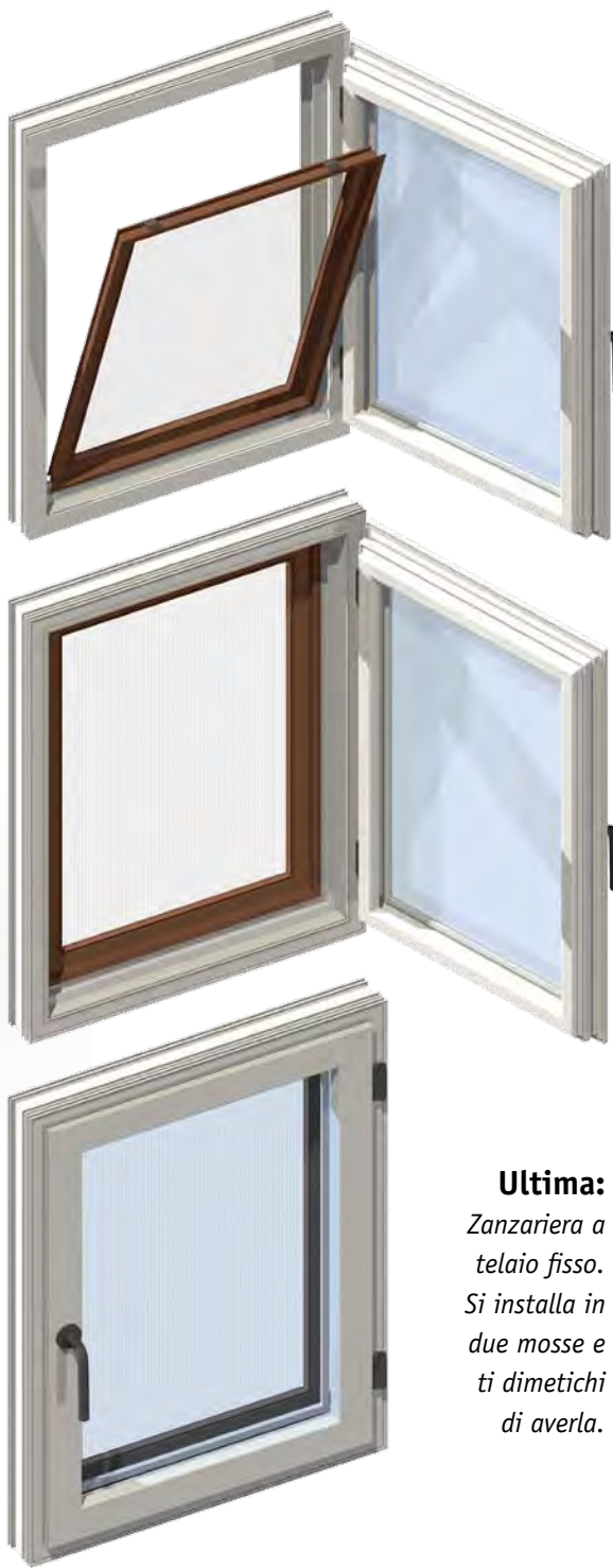
Ultima: Zanzariera a telaio fisso. Si installa in due mosse e ti dimentichi di averla.

“Prima” perchè, apparentemente, potrebbe essere una efficace “prima difesa” dagli insetti su tutti quei serramenti che, per ragioni economiche o tecniche, non abbisognano (o non consentono) l’installazione di sistemi più sofisticati e performanti. Sì, ma... Ma chi ha detto che se si deve fare una zanzariera semplice ed economica deve essere fatta per forza male? La nostra