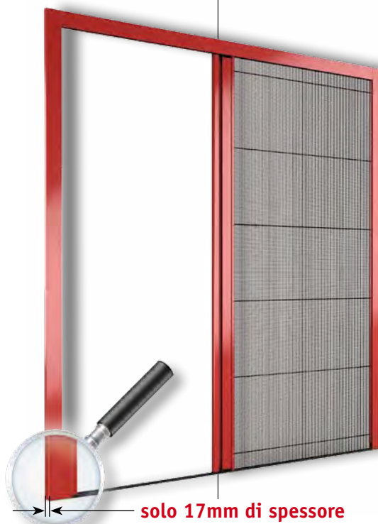
solo 17mm di spessore

Resterete anche voi a bocca aperta ( ma attenti che non ci entrino le zanzare! ).