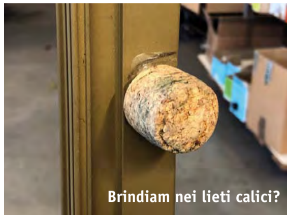
Brindiam nei lieti calici?

Avremmo voluto vedere la nostra faccia quando abbiamo aperto il pacco. Riceviamo spesso richieste di riparazione sui prodotti che, per varie ragioni, si danneggiano durante l'uso. Lo facciamo volentieri, è un servizio che mettiamo a disposizione per allungarne la vita e rendere tangibile l'assistenza post-vendita. Ci è capitato di vedere ogni tipo di danno, ma questa volta, però, siamo rimasti davvero a bocca aperta. Abbiamo ricevuto una spedizione con una richiesta di sostituzione per una rete danneggiata, ma mai ci saremmo aspettati di vedere come il cliente ha risolto un precedente problema. La maniglia della zanzariera, probabilmente smarrita o rotta, è stata rimpiazzata con un allegro... tappo da damigiana! Dopo un primo mo-