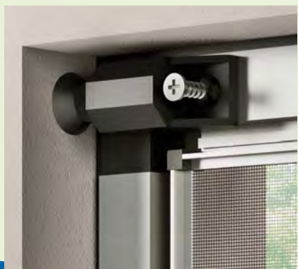
Unifix. Fissaggio angolare in luce

UNIFIX , inoltre, ha superato un'altra barriera che poteva impedire la collocazione di una zanzariera in contesti particolarmente pregiati o delicati: ha eliminato la necessità di forare i profili del serramento. Sia le staffe a "Z" che i blocchi angolari per i fissaggi "in luce" non richiedono di forare nulla, né usare viti, per tenere in posizione il telaio della zanzariera. Entrambi i sistemi garantiscono una sicura tenuta, senza pericolo che nulla possa spostarsi, nemmeno accidentalmente. Con UNIFIX puoi davvero compiere una "mission impossible".