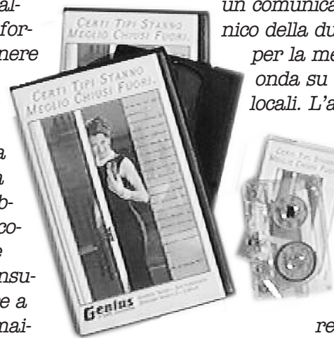
Uno spot pubblicitario è stato realizzato appositamente per incrementare le vendite dei distributori Genius.

Gruppo Genius vuole metterVi a disposizione. Contattatelo subito.