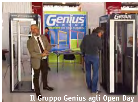
Il Gruppo Genius agli Open Day

Nei giorni del 23 Ottobre e 20 Novembre scorsi il Gruppo Genius ha partecipato come ospite ai convegni "Porte e Finestre & Co. FUTURE STRATEGY" organizzati, rispettivamente a Torino e a Cosenza, dal Consorzio LegnoLegno. Gli eventi si sono rivelati proficue giornate di cultura del serramento e hanno coinvolto le aziende dell'intera filiera proponendo aggiornamento e dibattiti sugli argomenti di più forte attualità, incluso il settore delle zanzariere. Abbiamo avuto modo di incontrare tante realtà territoriali e di confrontarci con gli imprenditori del settore che quotidianamente affrontano le difficoltà del lavoro "sul campo". Di suo, il Consorzio LegnoLegno, ha organizzato interessanti conferenze su argomenti all'ordine del giorno come l'adeguamento alle nuove normative o la presentazione di innovativi strumenti di marketing per affrontare le sfide dei nuovi mercati.