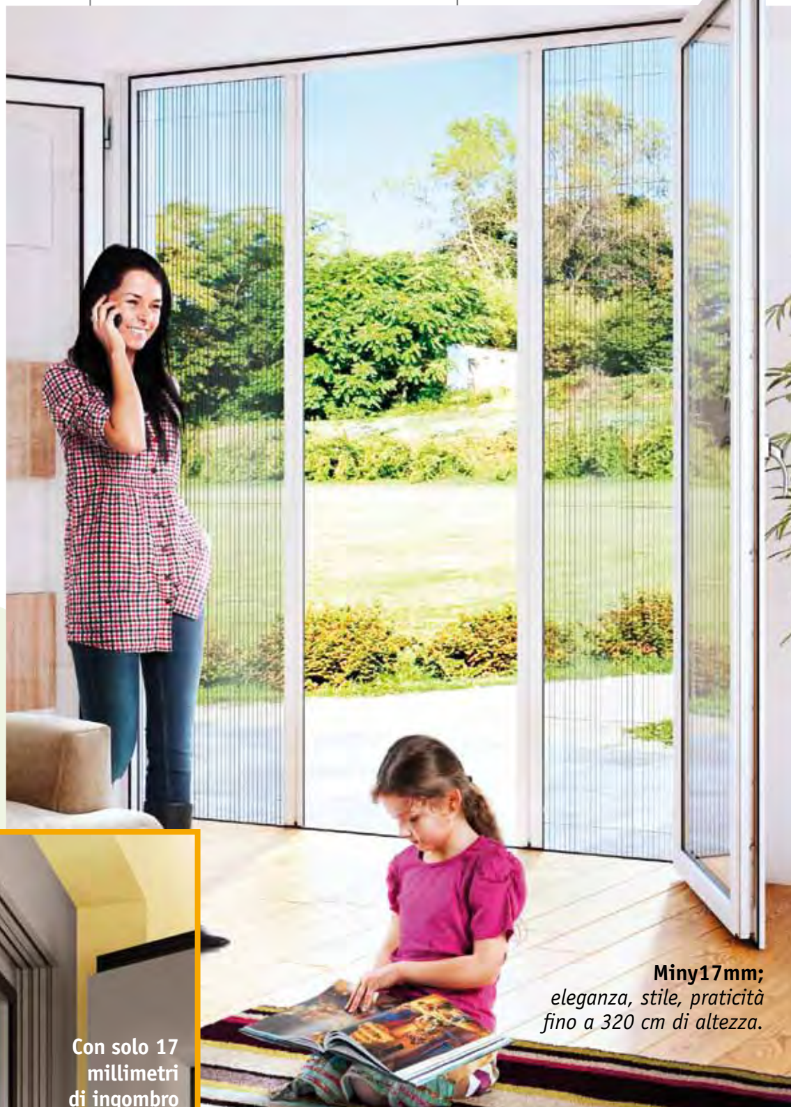
Miny17mm; eleganza, stile, praticità fino a 320 cm di altezza.

Con solo 17 millimetri di ingombro Miny17 sta proprio dappertutto!