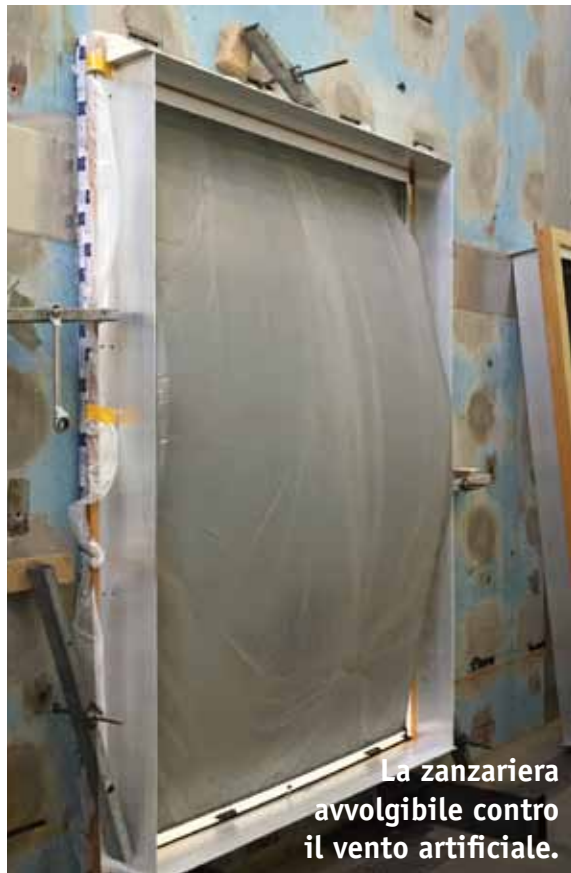
La zanzariera avvolgibile contro il vento artificiale.

bordi delle reti. La resistenza dimostrata è dovuta all'adozione degli opportuni spazzolini e al disegno delle guide. Meno fortunata è stata la Plissè che è stata classificata in Classe Zero. Ma non è stata una sorpresa, ce lo aspettavamo data la maggiore resistenza offerta al vento dalla aumentata superficie della rete plissettata rispetto ad una avvolgibile. A sfavore ha giocato anche il particolare sistema di movimentazione ad impacchettamento, che non permette l'adozione di spazzolini antivento sulla Plissè. Siamo, comunque, più che soddisfatti proprio in considerazione delle premesse e continueremo a sottoporre, a breve, gli altri modelli del nostro catalogo alle stesse prove qui descritte.