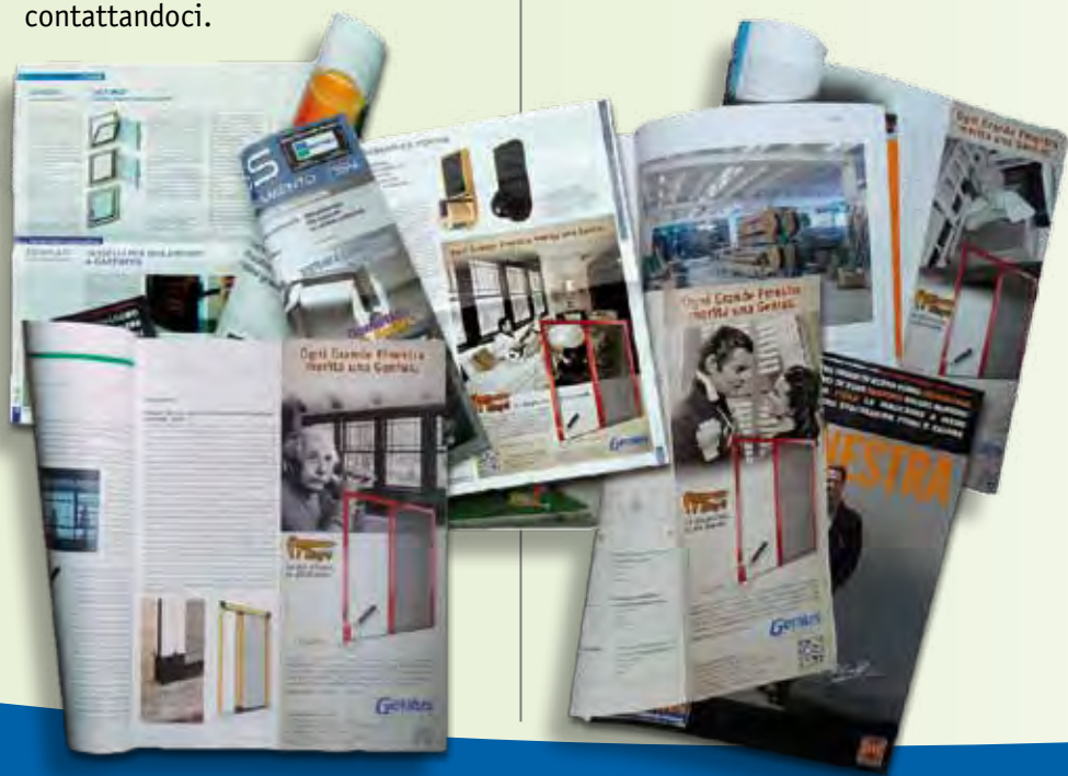
Esempi della Campagna Pubblicitaria Genius. Le zanzariere Genius compaiono sulle principali testate di settore.

sotto, sia quella rivolta ai consumatori che trova il suo spazio naturale su quotidiani e periodici locali. Vi ricordiamo, a tal proposito, che per i rivenditori che volessero approfittare della nostra grafica per pubblicizzare localmente i prodotti Genius è disponibile un servizio di consulenza gratuita (dettagli a pag.4). A completamento dell’offerta pubblicitaria potete richiederci anche pieghevoli, adesivi per automezzi, striscioni, display ed espositori. Tutti coordinati nell’immagine, altamente personalizzabili e senza limiti di quantità. Un buon imprenditore riconosce una buona occasione; siamo certi che saprete approfittare del valore aggiunto della comunicazione che il Gruppo Genius è pronto a mettervi a disposizione semplicemente contattandoci.