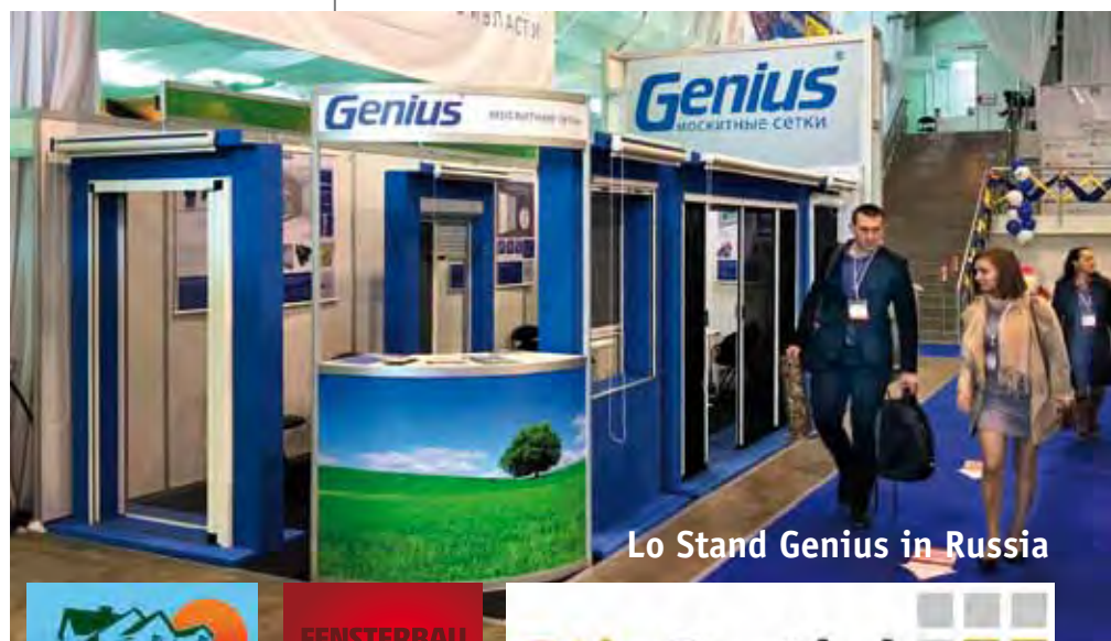
Lo Stand Genius in Russia