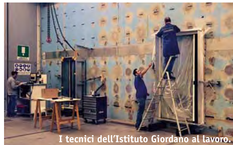
I tecnici dell'Istituto Giordano al lavoro.

L'esecuzione vera e propria prevede che il campione venga installato all'interno di un telaio e collocato a ridosso di un'ampia parete forata, dalla quale fuoriesce un flusso di aria a velocità controllata che ha lo scopo di simulare le raffiche