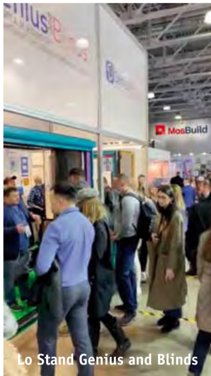
Lo Stand Genius and Blinds

A fine Marzo 2021 i prodotti Genius erano esposti alla più importante Fiera Internazionale della Federazione Russa: la Mosbuild 2021 . È stata una vera sorpresa per affluenza di pubblico -in presenza- e interesse ai nostri prodotti. La cosa che ci ha colpito di più, provenendo noi da una situazione di emergenza sanitaria ancora elevata, è stata la naturalezza con cui le persone si comportano: normalmente e senza temere le occasioni di socializzazione. Senza imprudenze, naturalmente, ma nemmeno terrorizzate. Non sappiamo se sia dovuto