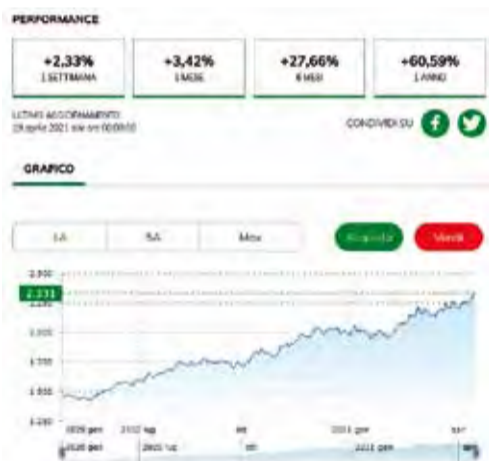
Quotazione alluminio da Gennaio 2020

Comunque, nonostante i segnali contrastanti, noi non molliamo facilmente perché sappiamo che ci sarà anche un "dopo". E siccome il Gruppo Genius c'è ora come c'era prima, non c'è dubbio che ci sarà anche dopo, per permettere a tutti di continuare l'attività con la certezza di una solida esperienza a sostegno dei professionisti. Ad Maiora!