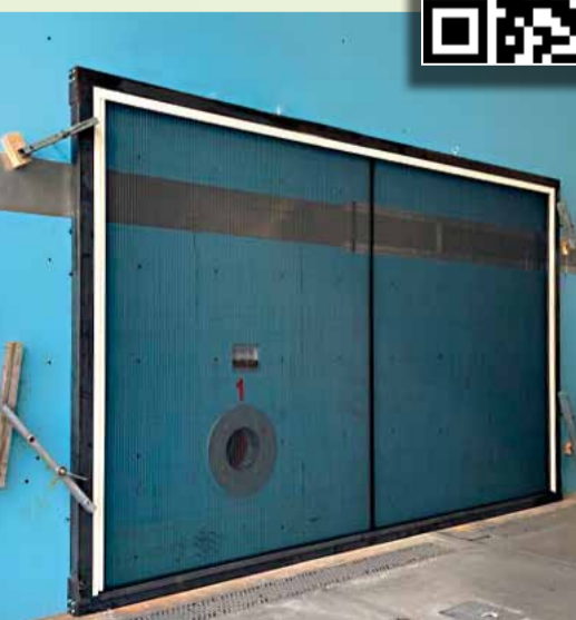
Magnum31mm Alla prova del vento all'Istituto Giordano.