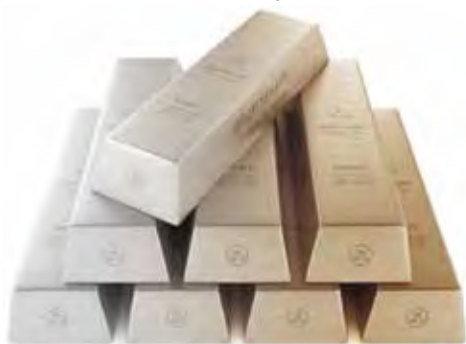
Alluminio come l'Oro?