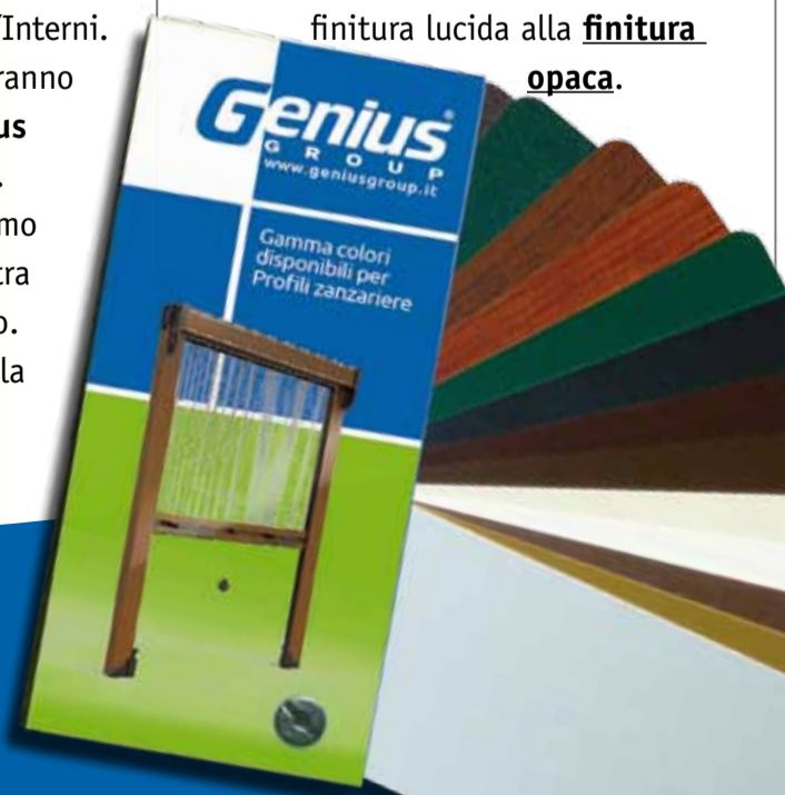
Nel 2025 Marrone RAL 8017 e Grigio RAL 7016 saranno disponibili solo opachi .

speciali su richiesta. Ma la novità per il 2025 riguarda due colori specifici, anzi due finiture, per essere precisi. Infatti, sia il Marrone RAL 8017 che il Grigio RAL 7016 passeranno dalla attuale disponibilità a catalogo con finitura lucida alla finitura opaca .