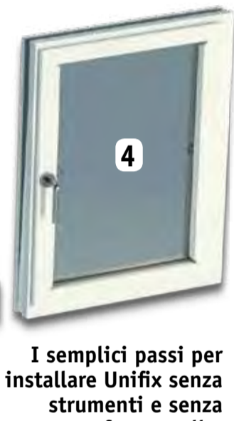
I semplici passi per installare Unifix senza strumenti e senza forare nulla.

leggera pressione esercitata dalle clip a molla mantiene il telaio ancora più saldo in posizione, sempre permettendone la facile rimozione senza strumenti e senza lasciare alcuna traccia.