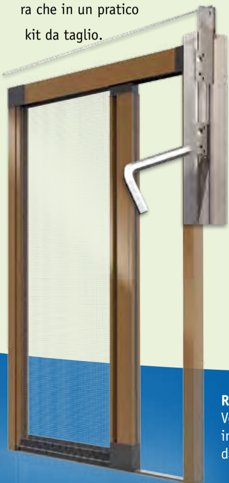
RollOut 38 Advance - R Versione con solo cingolo inferiore e cavo superiore da tensionare (nel dettaglio).

giore tenuta allo sfilamento della rete, pur mantenendo il profilo barra maniglia di dimensioni ridotte, come nei modelli RollOut e Maxxy. Completa il sistema un pratico "kit di compensazione fuorisquadro" che è disponibile per tutti i casi in cui le spallette non siano complanari e impediscano od ostacolino la corretta chiusura della barra maniglia. RollOut Advance-R utilizza i profili standard RollOut, per cui arriva a coprire fino a 140cm di apertura con un anta (280 con la doppia) ed è installabile con pochi accorgimenti anche nella versione da "incasso". RollOut Advance-R è disponibile ordinandola sia a misura che in un pratico kit da taglio.